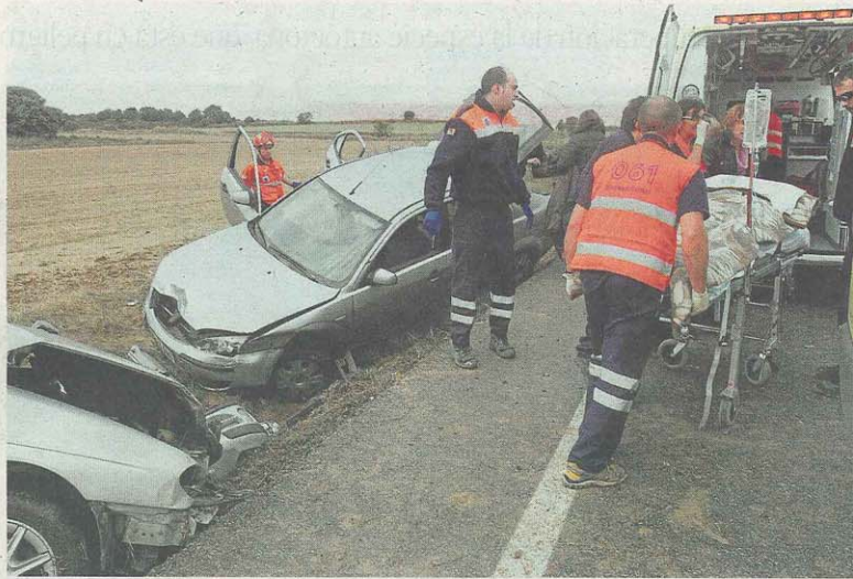
Sanitarios del 061 y de Protección Civil se hicieron cargo del traslado de los seis heridos. JAVIER BLASCO

Al lugar se desplazaron de inmediato efectivos de los parques de Bomberos de Huesca y de Barbastro, además de agentes de la Guardia Civil de Tráfico y cuatro am-