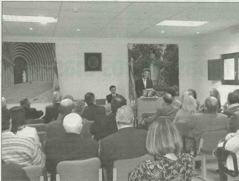
Bizen d'o Río, en el discurso que leyó durante el acto en el que el Instituto le reconoció su labor. S. E.

Ministro de la Primera Iglesia Unitaria, de la que Servet es considerado uno de sus inspiradores, en Woonsocket (Rhode Island, EEUU) desde 1986 a 1999, Hug-