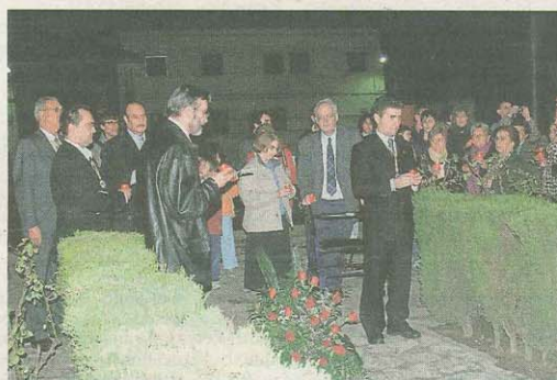
Los asistentes homenajearon a Servet con una ofrenda de fuego.